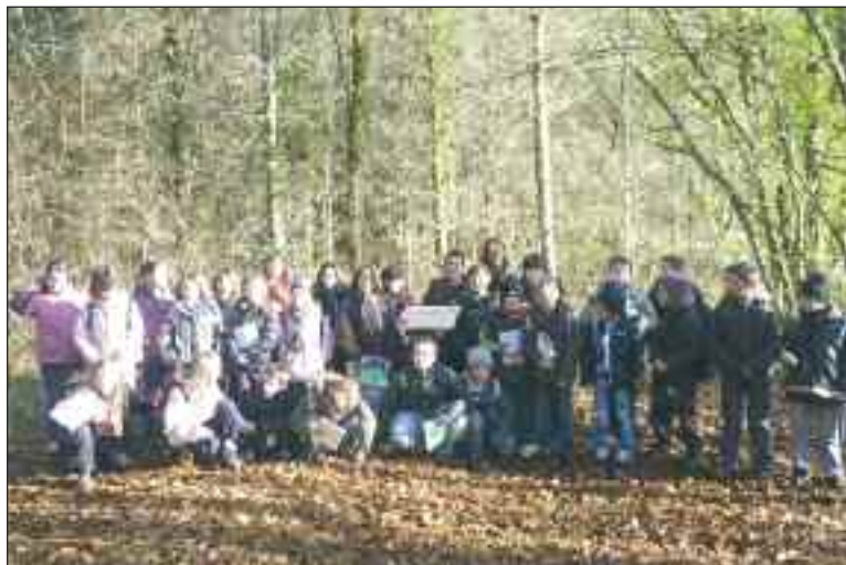
Après la pose du panneau, les enfants ont observé le sentier pour noter les changements intervenus depuis leur dernière balade

Le sentier Au fil des saisons est l'occasion pour cette classe, à raison de deux heures de cours par semaine environ, d'aborder presque toutes les matières autour de l'étude de la nature. Des temps en milieu naturel pour observer la faune et la flore avec le guide naturaliste Yannick Lenglet et les animateurs du hameau, les habitants eux-mêmes qui connaissent par cœur ce site nature qu'ils entretiennent avec sérieux.