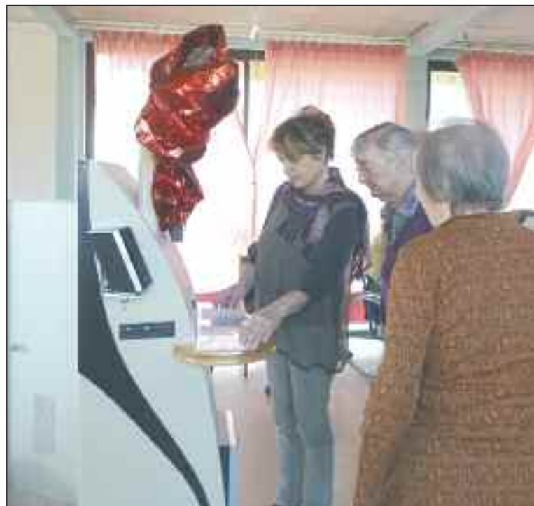
Les résidents et les animatrices ont testé Mélo