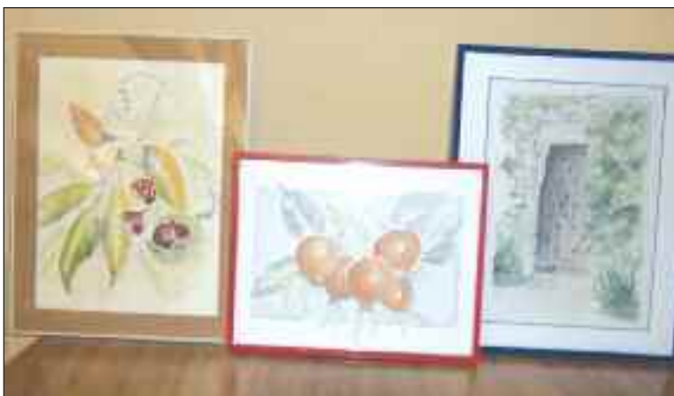
Les aquarelles de la tombola

Samedi 4 décembre, la commune de Proissans s'est une nouvelle fois mobilisée pour organiser le Téléthon, et le succès obtenu est plus que satisfaisant. 1 050,50 € ont été collectés et reversés à l'Association française contre les myopathies. Et ce grâce aux enfants et à leurs enseignantes du regroupement