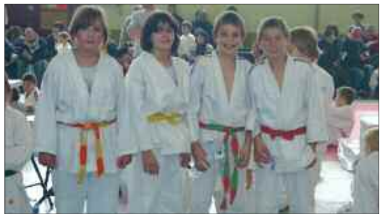
Les quatre jeunes qui se sont hissés en phases finales

Dimanche 28 novembre, le gratin des judokas benjamins de la Dordogne était rassemblé au dojo de Coulounieix-Chamiers. Cinq Belvésois ont offert un spectacle magnifique au public. Il est vrai que dans cette catégorie ils ont déjà cinq ans de pratique, et il y avait en plus l'effet championnat de France. Selon Paul Barret, judoka senior confirmé, cette année ils sont partis pour avoir beaucoup de satisfactions avec ces jeunes.