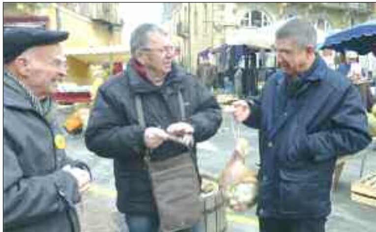
Pas une personne n'a échappé à la pesée du jambon

Petites sollicitations et grosses sommes à l'arrivée. C'est en proposant la pesée du jambon, des jacinthes prêtes à fleurir, des boissons chaudes, des crêpes, une marche, un match amical de football