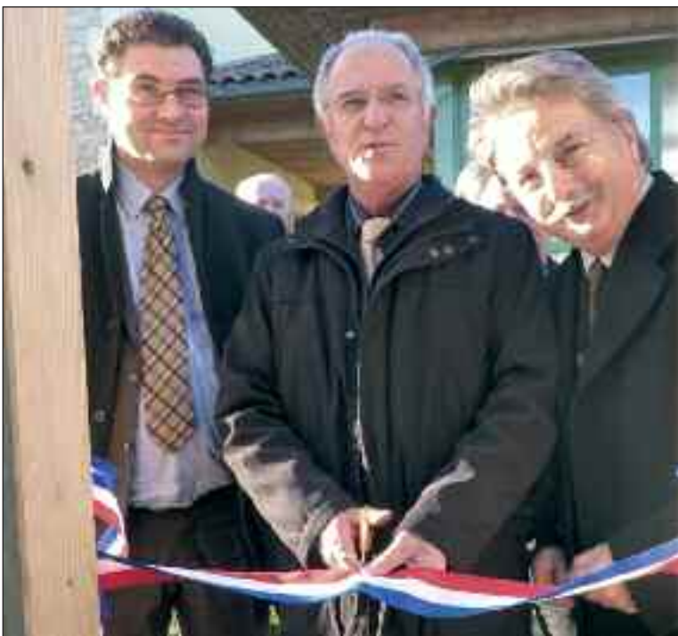
Le ruban est coupé, le contact est établi