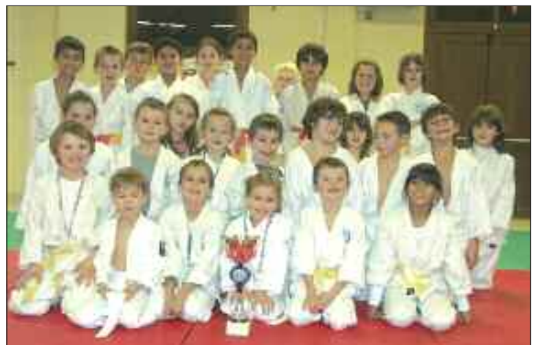
Le groupe des benjamins, des poussins et des minipoussins

Lors de la rencontre interclubs à Belvès, le Judo-club était bien représenté puisque trente et un judokas s'étaient déplacés, accompagnés de leur famille et de leurs amis.