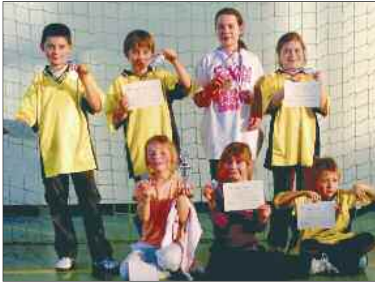
Les moins de 9 ans à l'issue de leur première rencontre interclubs

Dimanche 28 novembre au Mascolet, les moins de 13 ans recevaient La Force.