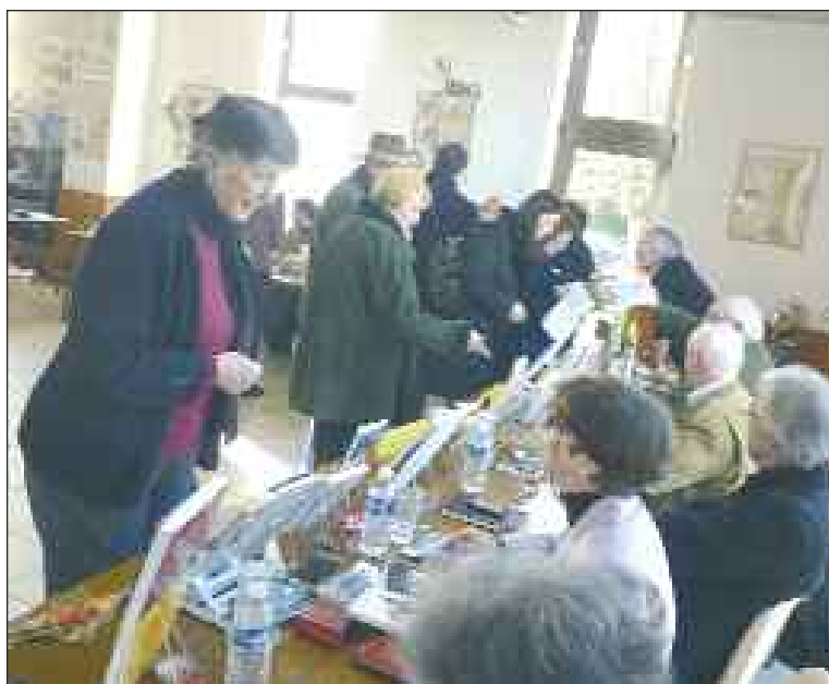
Le plaisir de rencontrer les écrivains