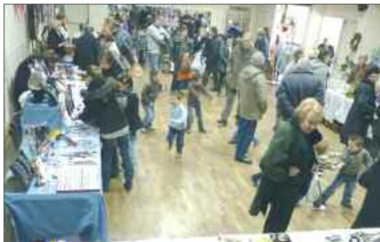
Chacun a trouvé le petit sujet qui fera plaisir